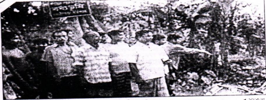
■ বানারীপাড়া : গাভা বধ্যভূমি চিহ্নিত করছেন প্রত্যাশদর্শীসহ স্থানীয়রা