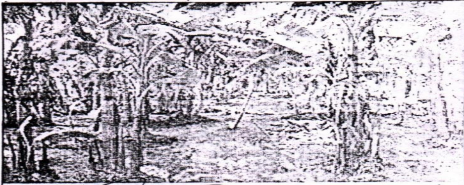
বানারীপাড়ায় নরেরকাঠী বৈধ্য ভূমির একাংশ কলা বাগানে পরিণত হয়েছে